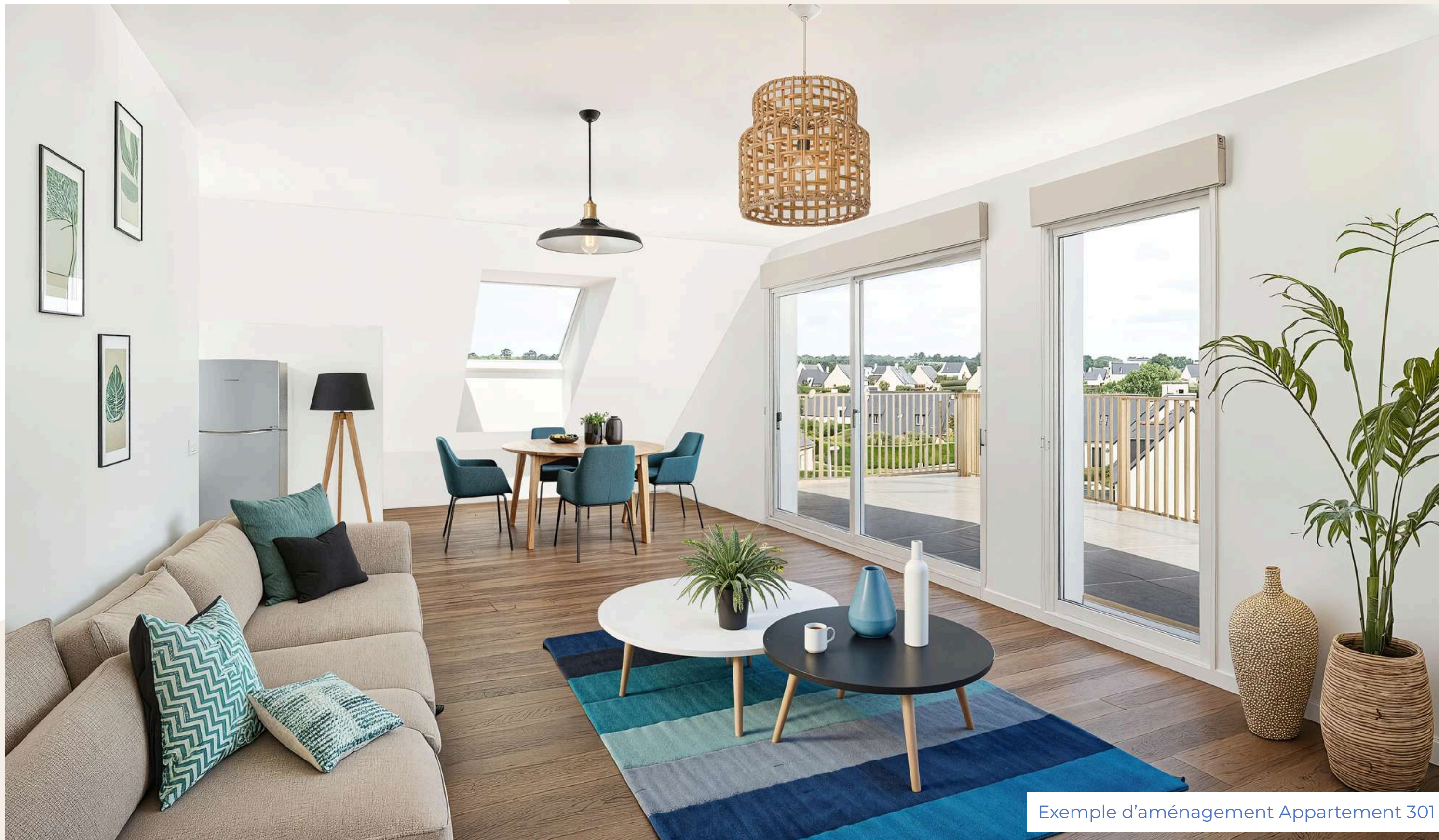
Exemple d'aménagement Appartement 301